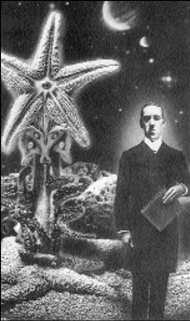
H.P. Lovecraft. Portada de J. K. Potter per a la revista Heavy Metal