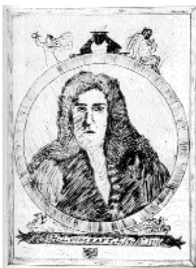
Autorretrat de Lovecraft